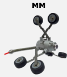
jProbe CT 280-300 Арт. JCT280300