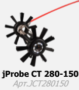
jProbe CT 280-150 Арт. JCT280150