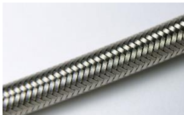
ПРОЧНАЯ ГЕРМЕТИЧНАЯ МЕТАЛЛИЧЕСКАЯ ОПЛЕТКА ЗОНДА