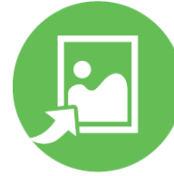
ФОТО JPEG 640 X 480